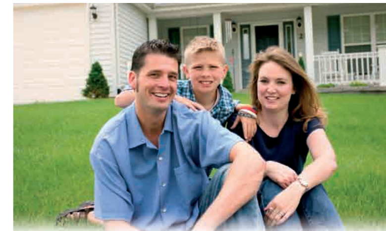
My korzystamy z rozwiązań JUDO