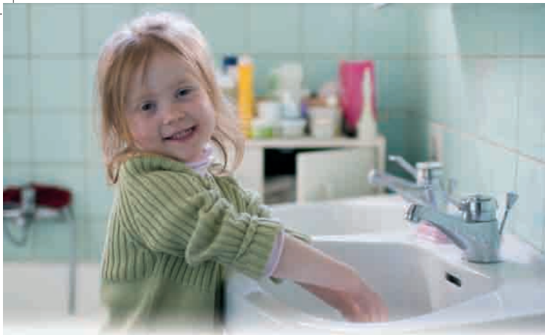
Codzienny komfort korzystania z miękkiej wody